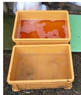
推奨される 踏込消毒槽の設置方法