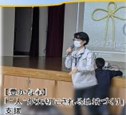
【豊かな心】 「人」が大切にされる地域づくり」支援