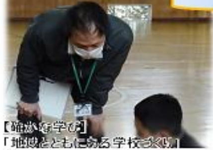
【踏ん張る学び】 「地域とともにある学校づくり」 「地域づくり」「人づくり」支援