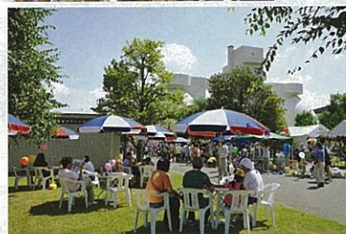
※写真は昨年(平成21年9月)のクリーンピア千曲まつりの様子です。