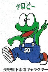
長野県下水道キャラクター

主催： 社団法人日本下水道協会 株式会社日本水道新聞社 後援： 国土交通省 環境省 協賛： 毎日新聞社 少年朝日ジャーナル 全国新聞教育研究協議会