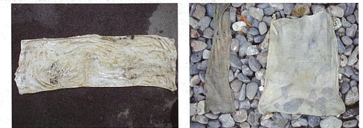
下水道に捨てられた異物(タオル、洗たくネットなど)です。

台所、トイレなどの排水口や汚水ます(マンホール)に生ゴミ、油、布切れ、プラスチックのかけら、有害な化学物質などは「流さない、捨てない」ようお願いします。