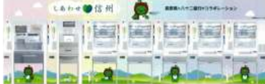
店舗装飾に（平安堂様、八十二銀行様他）