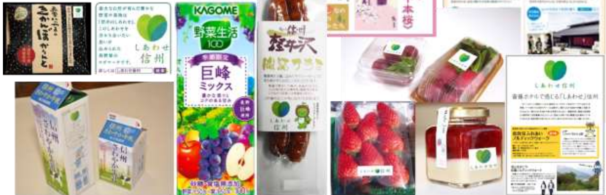
商品ラベルなどに（ハケ岳乳業様、カゴメ様、信州ハム様、ぱばな農園様、高丘フルーツ様他）