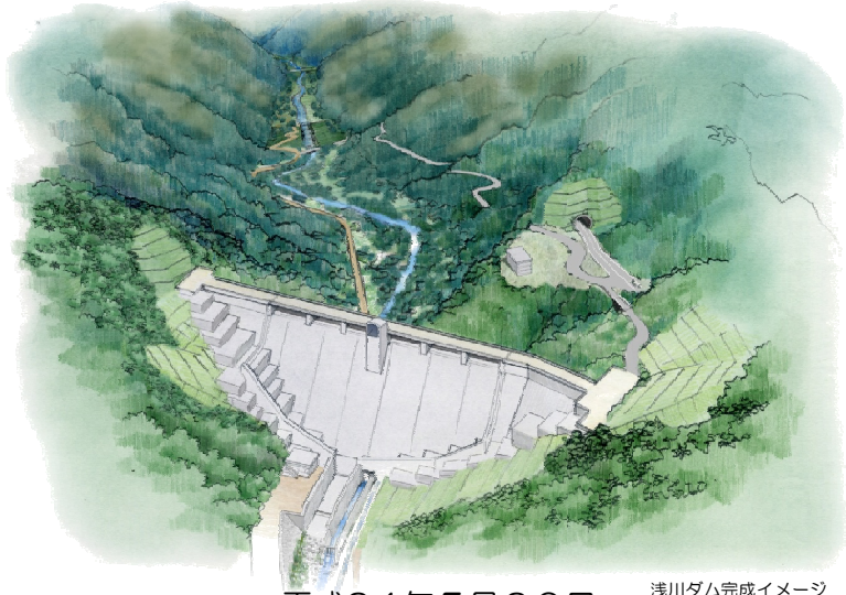
浅川ダム完成イメージ