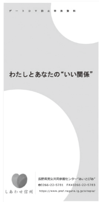
デートDVリーフレット