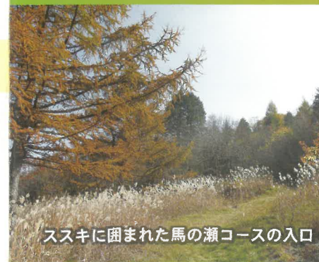
ススキに囲まれた馬の瀬コースの入口

お問い合わせ先 長野県南信州地域振興局 林務課 TEL.0265-23-1111 (代) 長野県木曾地域振興局 林務課 TEL.0264-24-2211 (代) ブログは“南信州お散歩日和”をご覧ください。