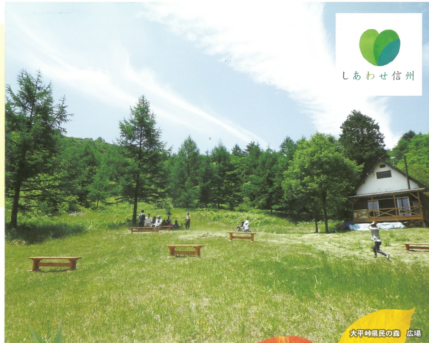
大平峠県民の森 広場