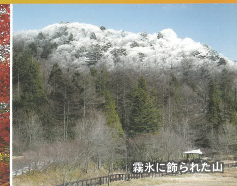
霧氷に飾られた山