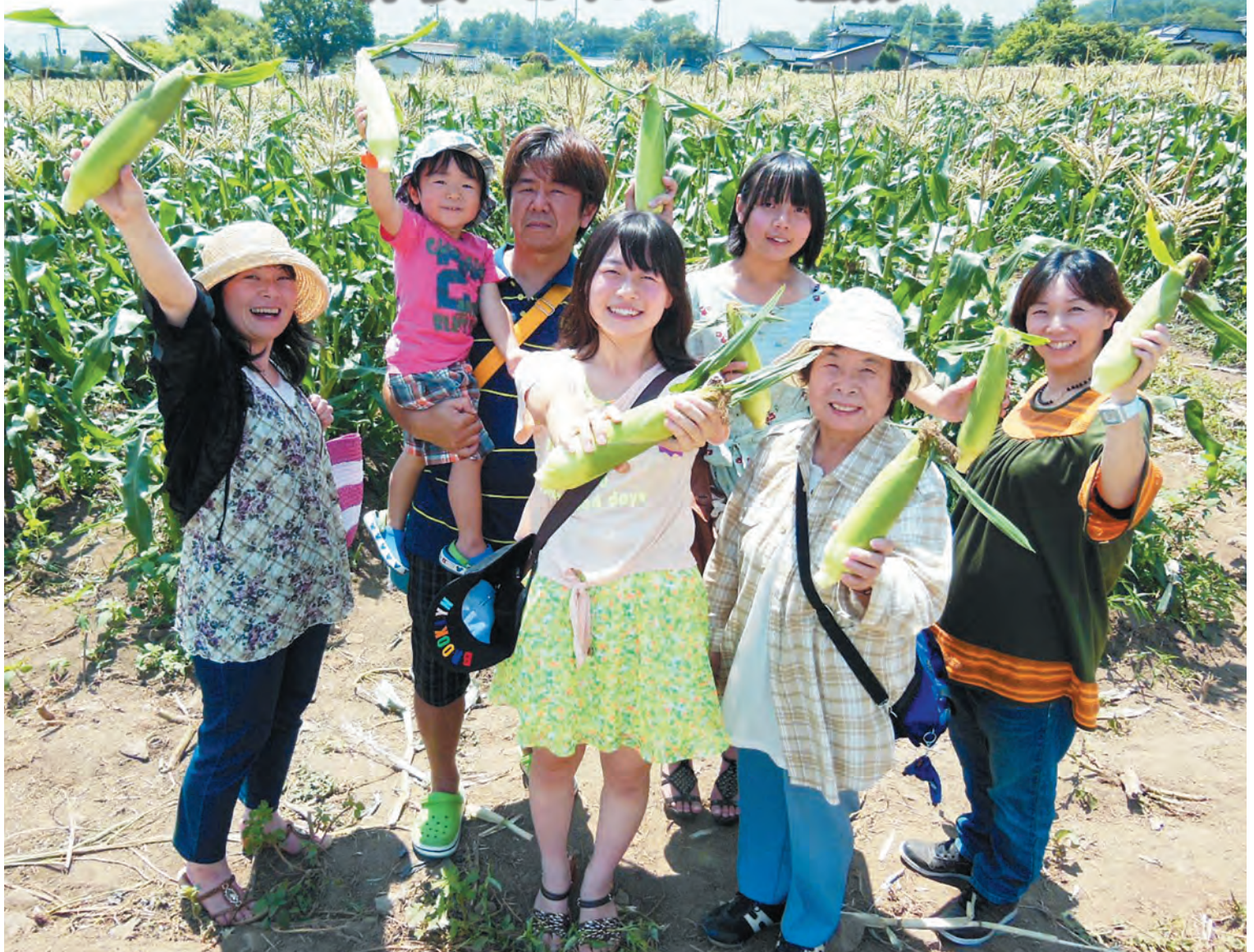
みはらしファーム（伊那市）とれたて体験