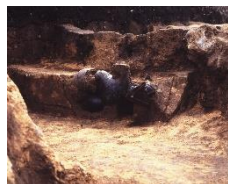
国宝「土偶」(縄文のビーナス・仮面の女神)