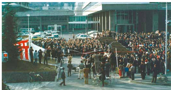
長野県庁での歌碑除幕式

歌碑の除幕式は、長野、松本とも千人近くが参加して行われましたが、感激の涙を流し、「信濃の国」を歌いながら綱を握りしめている参加者の姿が目に残っています。