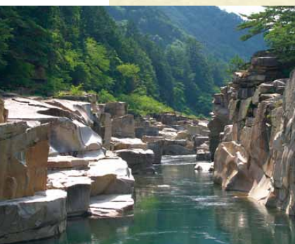
寝覚めの床

「信濃の国」は4番で曲調が変わり、優美な景観を歌うのにふさわしく、ゆったりとした曲になっています。6番まである曲に変化をつけると同時に、「寝覚めの床」、「姨捨山」の2カ所の字余りを解消し、歌詞の一字一句をはっきり歌えるようにするための緻密な配慮です。