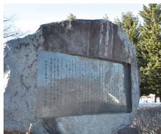
松本運動公園入口に建立されている歌碑

(注)明治4年の廃藩置県により、筑摩県(主に長野県の中部・南部と岐阜県飛騨地方)と長野県(主に長野県の北部・東部)が置かれました。その後、明治9年の筑摩県庁舎の焼失を機に、飛騨地方を除く筑摩県と長野県の合併が行われました。