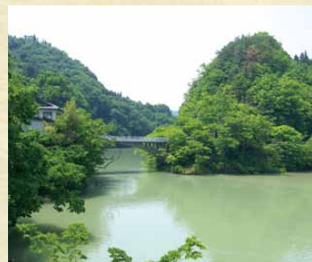
久米路橋・犀川

4 番で歌われている『筑摩の湯』は現在の美ヶ原温泉から浅間温泉にかけての一带だといわれています。なお、『園原』(阿智村)『寝覚めの床』『木曾の棧』(上松町)『久米路橋』(長野市)『姨捨山』(千曲市)のいずれも長野県内の名勝です。