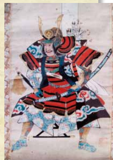
仁科五郎信盛 (伊那市立高遠歴史博物館 蔵)

さらに詳細な歌詞の意味や歌詞に出てくる用語については、 こちらから ご覧いただけます。