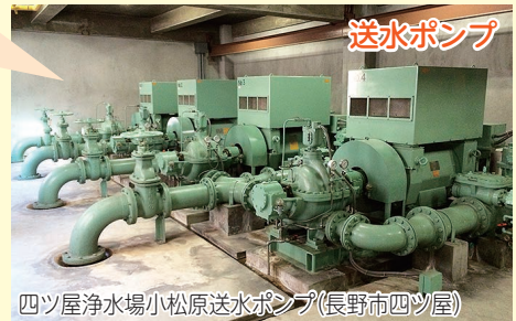
四ツ屋浄水場小松原送水ポンプ(長野市四ツ屋)