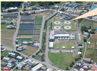
諏訪形浄水場 (上田市)