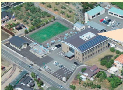
四ツ屋浄水場 (長野市)