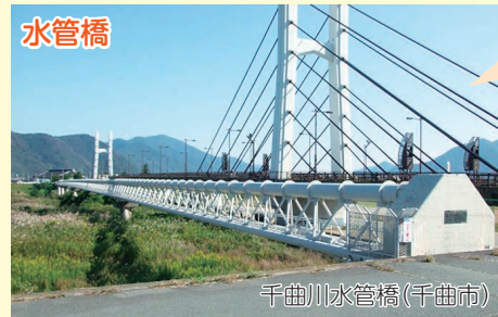
千曲川水管橋(千曲市)