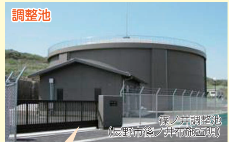
篠ノ井調整池 (長野市篠ノ井布施五明)

供給量の少ない夜間に、浄水場からの送水を貯留しておくことで、水の安定供給が図られます。