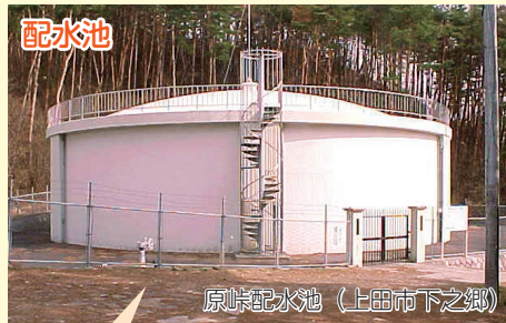
原峠配水池 (上田市下之郷)