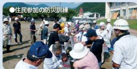
●住民参加の防災訓練