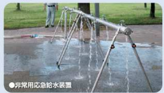
●非常用応急給水装置