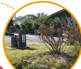
坂城町文化センター