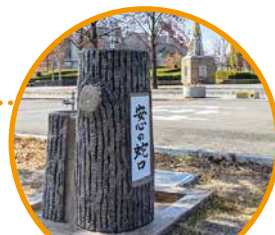
南長野運動公園(長野市)