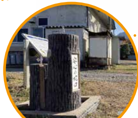
上田市立東塩田小学校