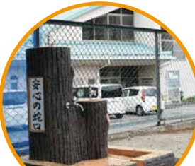
坂城町立坂城小学校