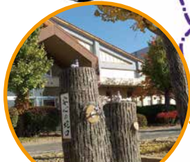
上田市立第六中学校