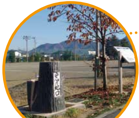
上田市立塩田中学校