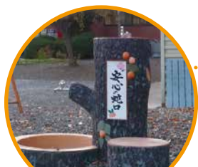
千曲市勤労者体育センター