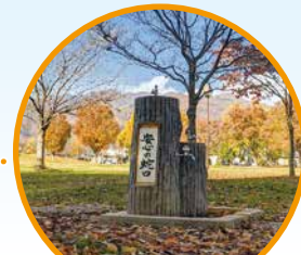
三本柳中央公園(長野市)