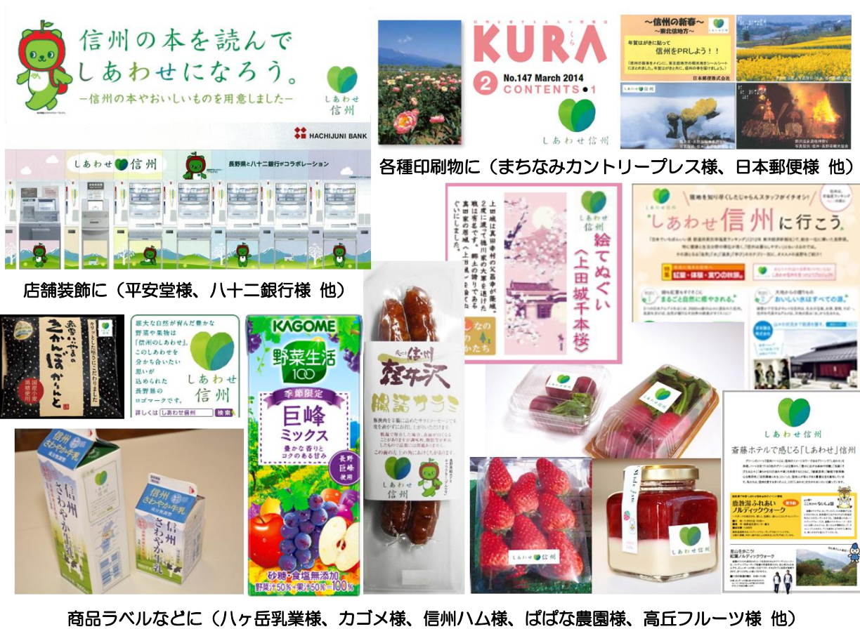
各種印刷物に（まちなみカントリープレス様、日本郵便様 他）