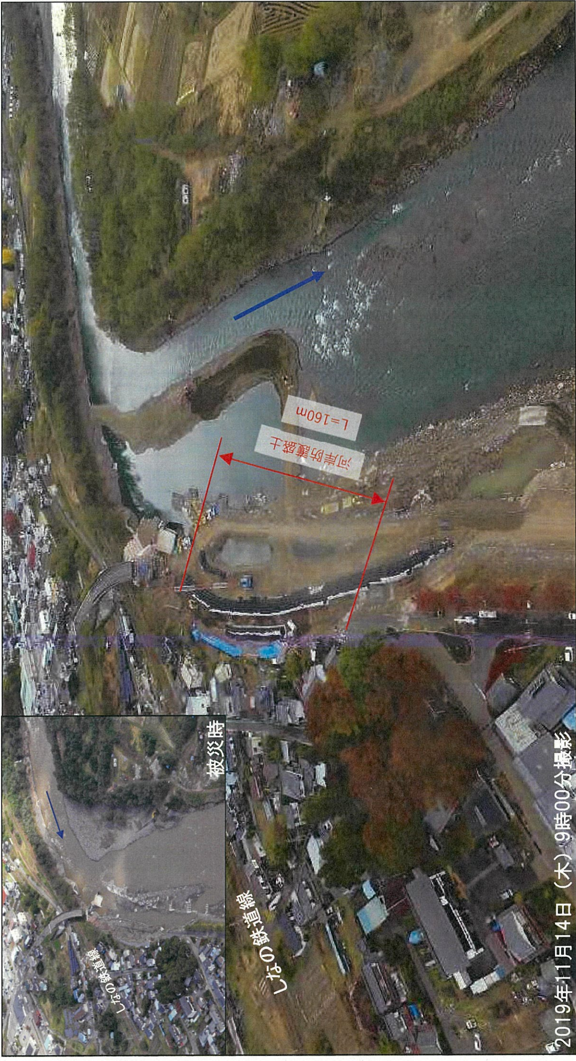
2019年11月14日 (木) 9時00分撮影